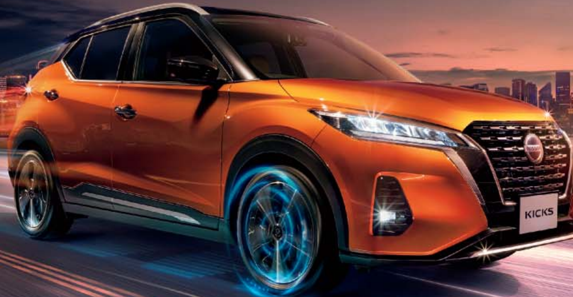
Photo: X ボディカラーはプレミアムライオンオレンジ (PM)、ピュアブラック (PB)、ストーン (ST) 標準色 (82,500円)。 インテリジェントアラウンドビューモニター (移動物検知機能付)、インテリジェントブレーキアシスト (IS-BC) は メーカーオプション。

夜間の住宅地も静かに走行。車内も驚くほど静かなので会話や音楽視聴を妨げることがありません。